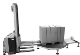
Option châssis support pour utilisation avec les gerbeurs